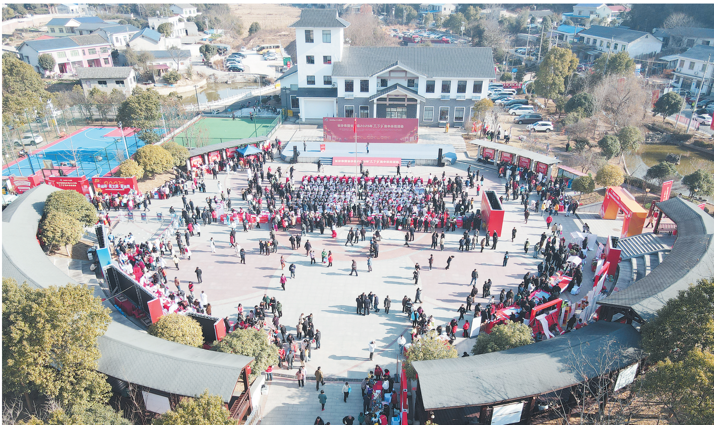
每一年,“三下乡”集中示范活动聚焦村民实际需求和所思所盼,为村民送上“惠民大礼包”。