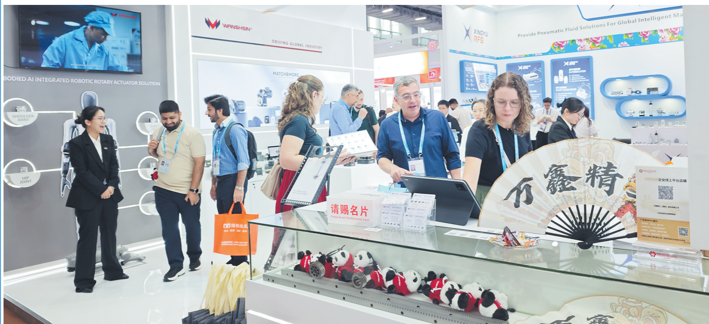
本届广交会吸引了长沙201家企业携379个展位亮相。长沙企业万鑫精工的展台前围满大量海外客商。

长沙晚报4月16日讯(全媒体记者 刘捷萍)4月15日，第139届中国进出口商品交易会(广交会)在广州盛大启幕。作为全球贸易的“晴雨表”与“风向标”，本届广交会吸引了长沙201家企业携379个展位亮相。“长沙智造”主动对接全球商机，充分展现外贸的强劲韧性与创新活力。